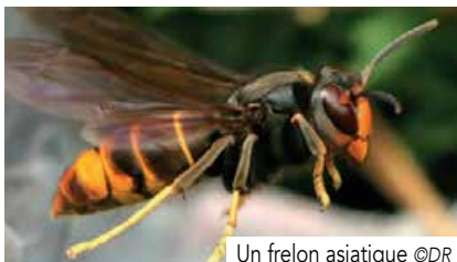
Un frelon asiatique

M algré les efforts de lutte pour réduire cette colonisation, l'installation du frelon asiatique progresse dans le Bas-Rhin et notre territoire est aujourd'hui très impacté.