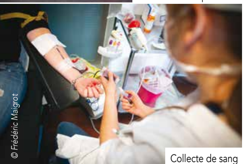
Collecte de sang