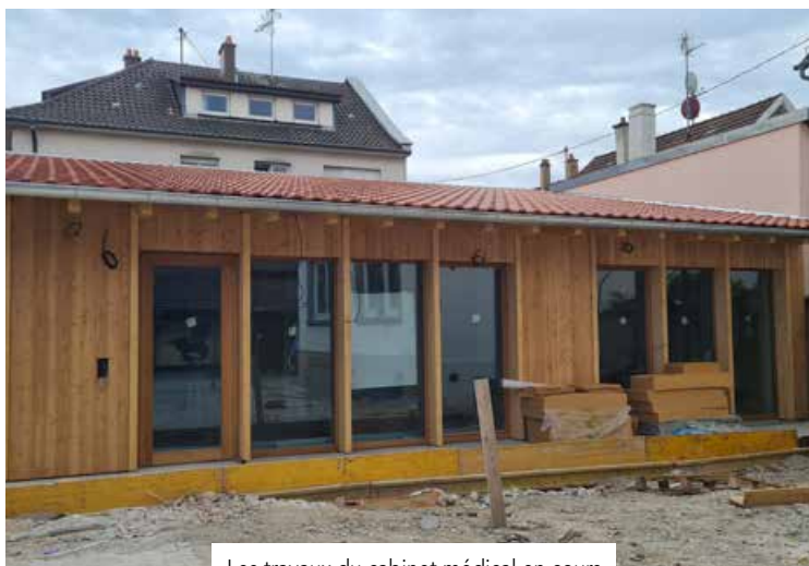
Les travaux du cabinet médical en cours

Deux équipements, un même objectif : améliorer la qualité de vie des Hoenheimois en proposant des services modernes, accessibles et adaptés aux besoins de tous. Nous aurons le plaisir de vous faire découvrir ces réalisations plus en détail dans un prochain numéro du magazine communal.