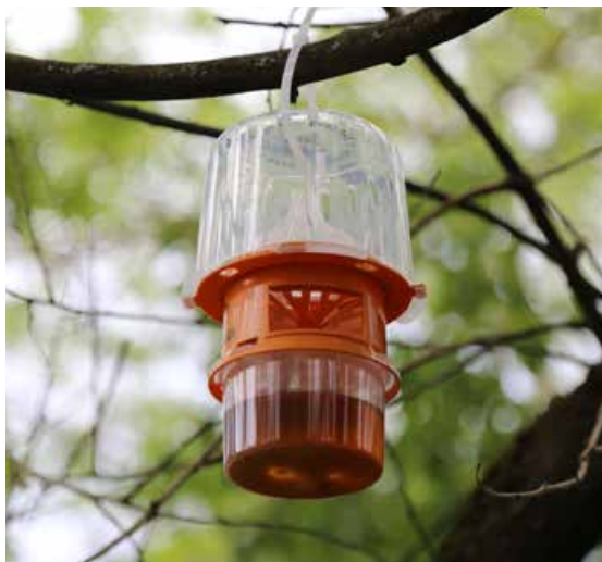
Piège sélectif à frelons asiatiques installé au terrain d'aventures