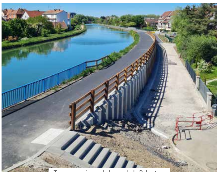
Travaux au niveau de la rue de la Robertsau

Les travaux de la Vélostras Nord touchent à leur fin et vont s'achever courant mai. Cette nouvelle liaison, déjà praticable pour les cyclistes et les piétons, offre un itinéraire sécurisé et agréable pour les déplacements du quotidien comme pour les loisirs.