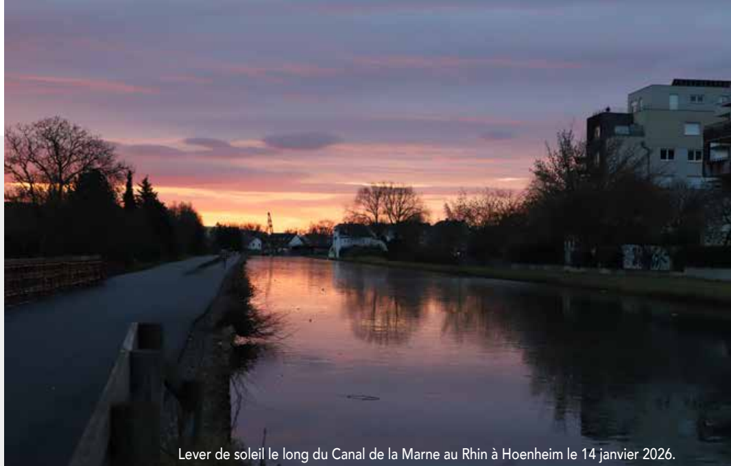
Lever de soleil le long du Canal de la Marne au Rhin à Hoenheim le 14 janvier 2026.