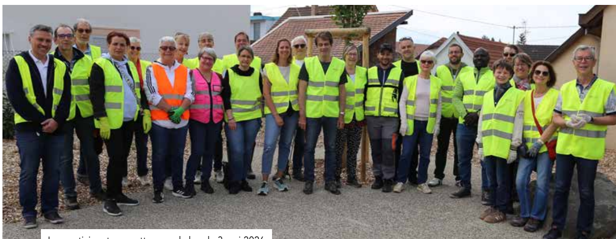
Les participants au nettoyage du ban le 3 mai 2026