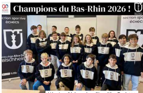
L'équipe d'échecs du collège Alice Daul

Après avoir décroché une très belle 4 ème place lors du dernier championnat de France, les élèves du Collège Alice Daul ont confirmé leur excellent niveau le samedi 31 janvier à Erstein. Ils s'imposent brillamment et deviennent Champions du Bas-Rhin des collèges , avec 4 points d'avance, se qualifiant ainsi pour le Championnat d'Alsace.