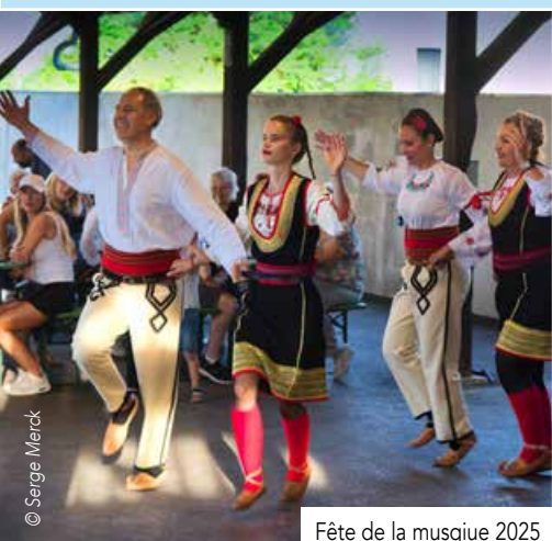
Fête de la musique 2025

COCORICO 2 CHRISTIAN CLAVIER DIDIER BOURDON Salle des Fêtes - 16 rue de Entrée 4 € (3€ pour les moins de 16 ans) salle de projection affiliée à la CRCC - Coopérative Régionale du Cinéma INFO : Service Culture Tél : 03.88.19.23.73 manifestations@ville-hoenheim.fr www.ville-hoenheim.fr Hoenheim.officiel