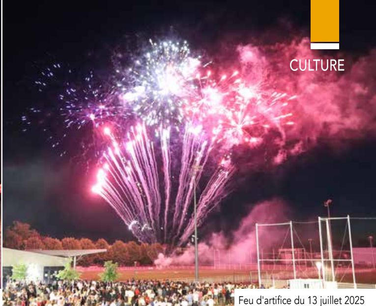
Feu d'artifice du 13 juillet 2025