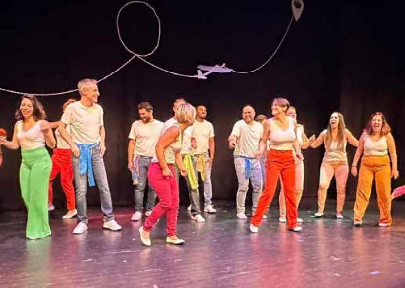
Les Voix Loups avec la comédie musicale "mon Eldorado" le 6 juin à la salle des fêtes