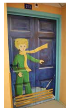
Quelques exemples de portes de chambres de l'EHPAD personnalisées.