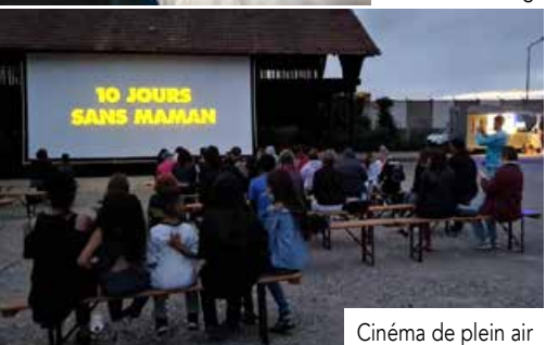
Cinéma de plein air