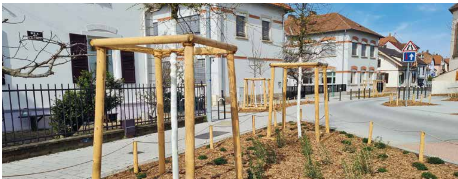
Végétalisation des rues de l'École et des Voyageurs