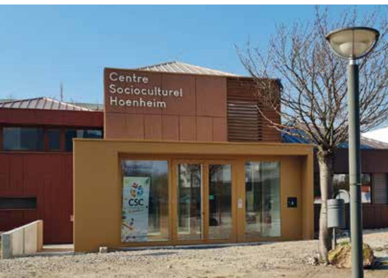
Le Centre Socioculturel de Hoenheim renové et agrandi

Une étude portant sur l'implantation de panneaux photovoltaïques sur les bâtiments municipaux a été diligentée et permettra de vérifier toutes les opportunités.