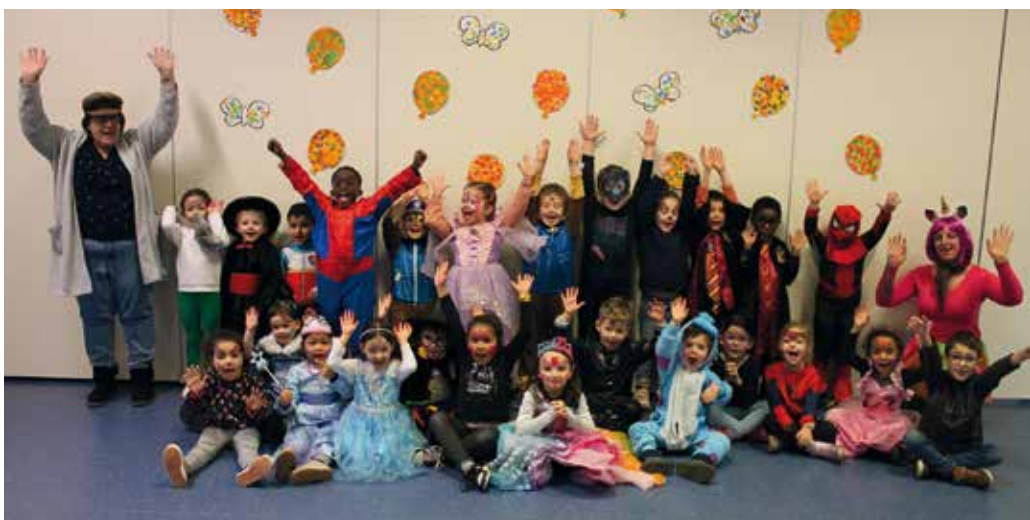
Journée carnavalesque à la garderie des vacances

Princesses, super-héros et monstres gentils se sont retrouvés pour une belle photo souvenir de ce moment.