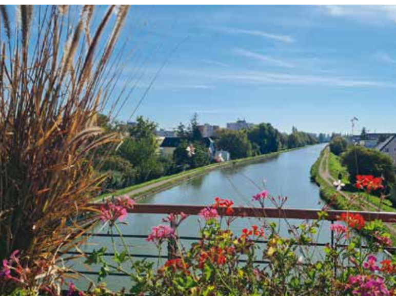
Fleurissement du pont du canal de la Marne au Rhin en été 2022