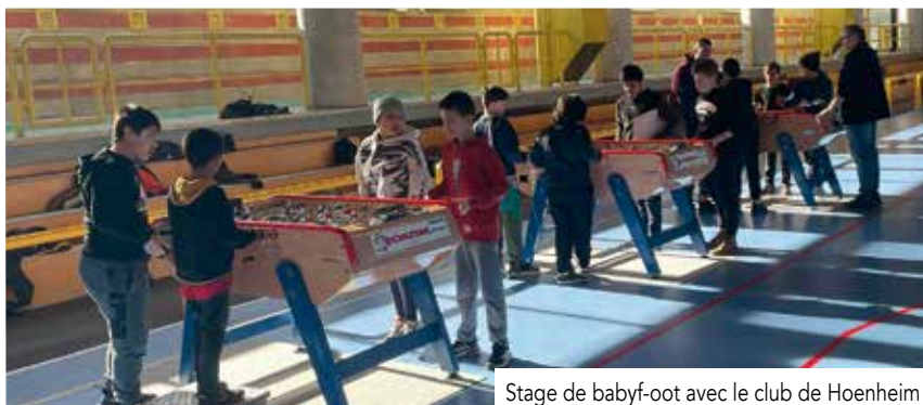
Stage de baby-foot avec le club de Hoenheim

Le programme des activités hivernales organisées par le service jeunesse et sports et le Centre socioculturel de Hoenheim fut un succès.