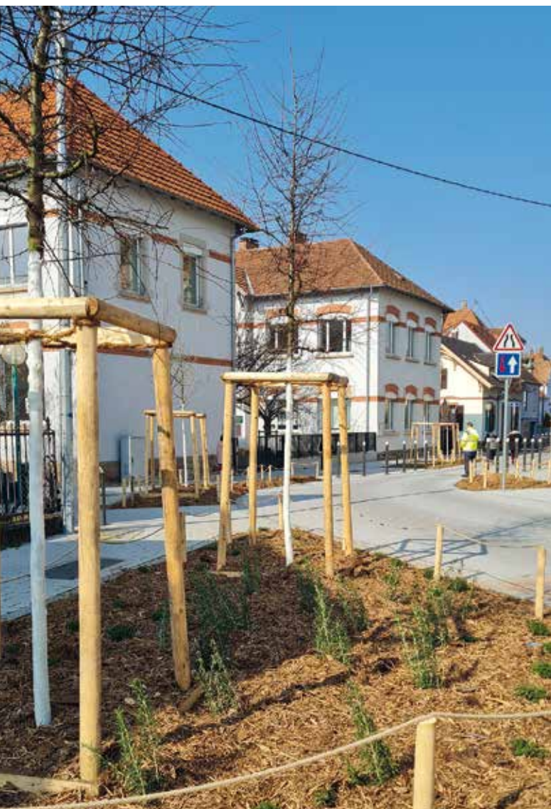
Aménagement de la zone de rencontre rue des Voyageurs/rue de l'École