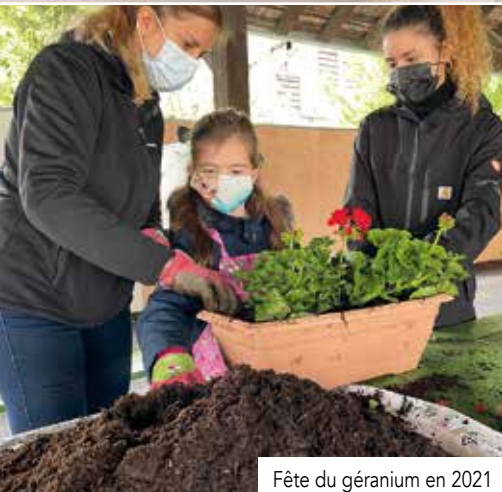
Fête du géranium en 2021