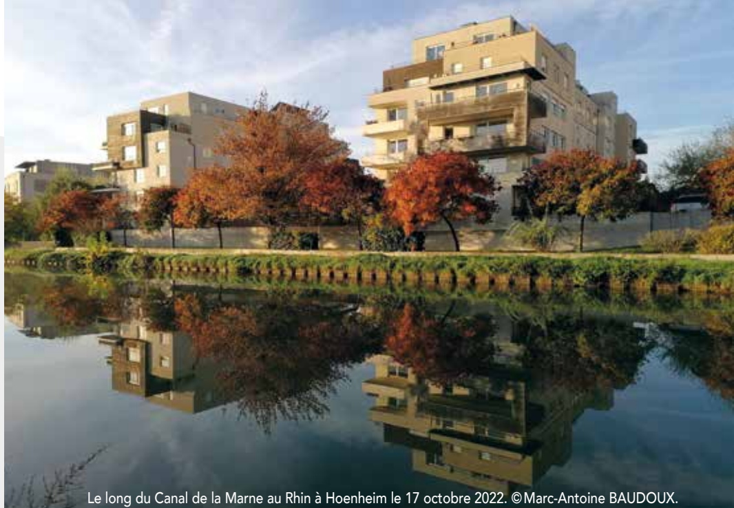
Le long du Canal de la Marne au Rhin à Hoenheim le 17 octobre 2022.