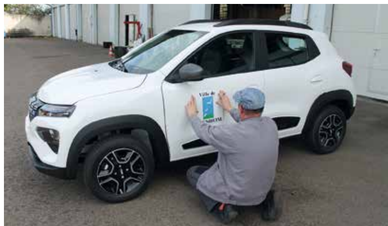
Nouveau véhicule électrique pour l'agent de surveillance de la voie publique

D es travaux d'aménagements extérieurs, de rénovation de bâtiments ou de voirie et de mises en conformité sont régulièrement nécessaires dans la ville. La municipalité de Hoenheim met un point d'honneur à toujours réaliser ces travaux dans les meilleurs délais et en priorisant les besoins.