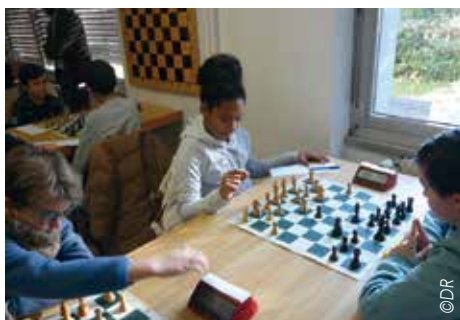
Les jeunes en compétitions interclubs

Vous aimez les longs combats stratégiques qui nécessitent endurance et ténacité ? Les cadences lentes sont pour vous. Vous préférez les montées d'adrénaline et les attaques foudroyantes ? Vous aimerez les tournois de matches rapides. Il y en a pour tous les goûts !