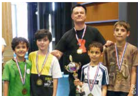
L'équipe vainqueur du critérium en mai 2022 avec leur président/entraîneur.

L'an dernier deux équipes de jeunes étaient engagées en Challenge et Critérium. Chacune a terminé à la première place de son groupe et le club a raflé les deux coupes.