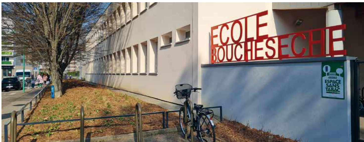
Végétalisation des abords de l'école Bouchesèche