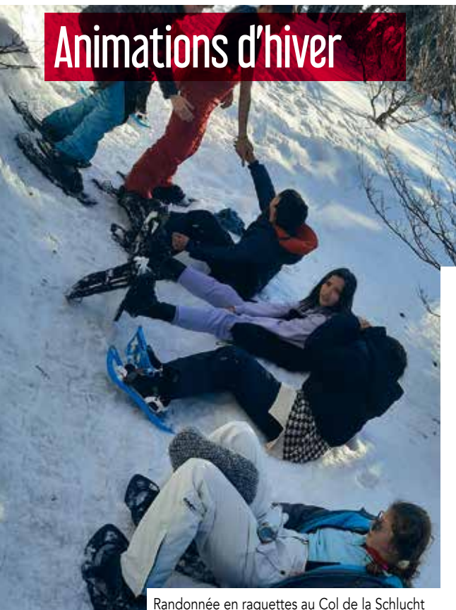
Randonnée en raquettes au Col de la Schlucht