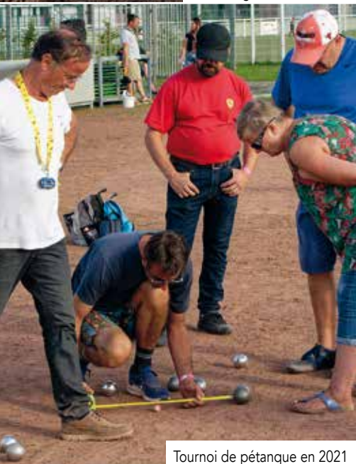
Tournoi de pétanque en 2021