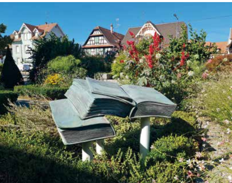
Fleurissement de la place de la Mairie en été 2022