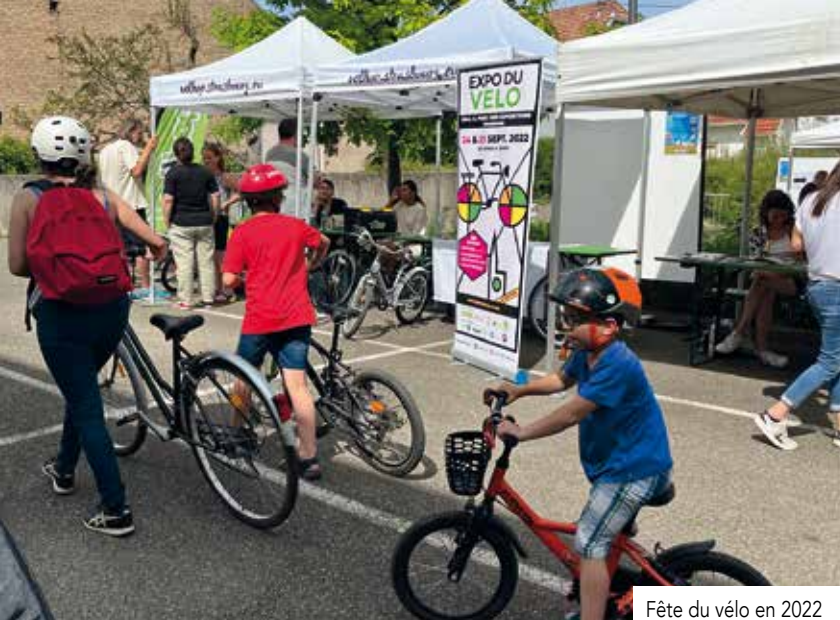
Fête du vélo en 2022