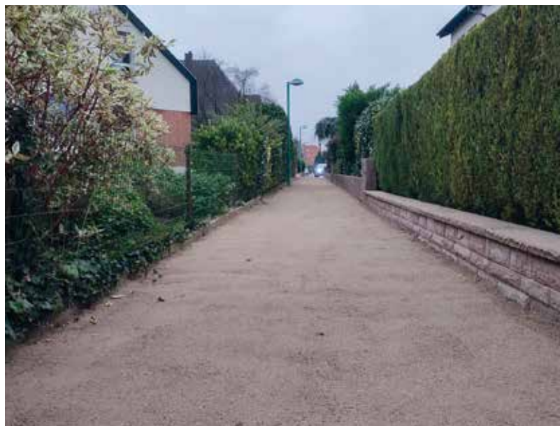
Un chemin réaménagé du Lotissement Champfleury

Il a fallu à l'auto-entrepreneur chargé des travaux pas moins de neuf big bags de concassés d'un poids de 1,4 tonnes chacun, de deux livraisons sur quatre sites différents pour donner une nouvelle jeunesse à ces chemins. La finition à l'aide d'une plaque vibrante a permis de retrouver des chemins facilement accessibles pour les habitants du lotissement.