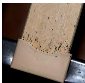
Traces noires de déjection (ex : sur les sommiers, ...)