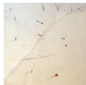
Tâches de sang sur les draps