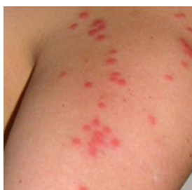
Piqûres sur le corps