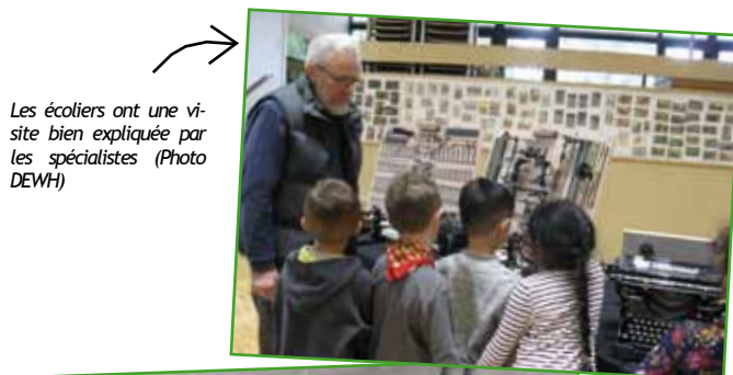
Les écoliers ont une visite bien expliquée par les spécialistes

Les prochains rendez-vous : le Hutzel's Cabaret le 20 octobre, le cinéma le 2 novembre, Roby & Co et son jazz le 9 novembre ... Voir les pages 12 et 13.