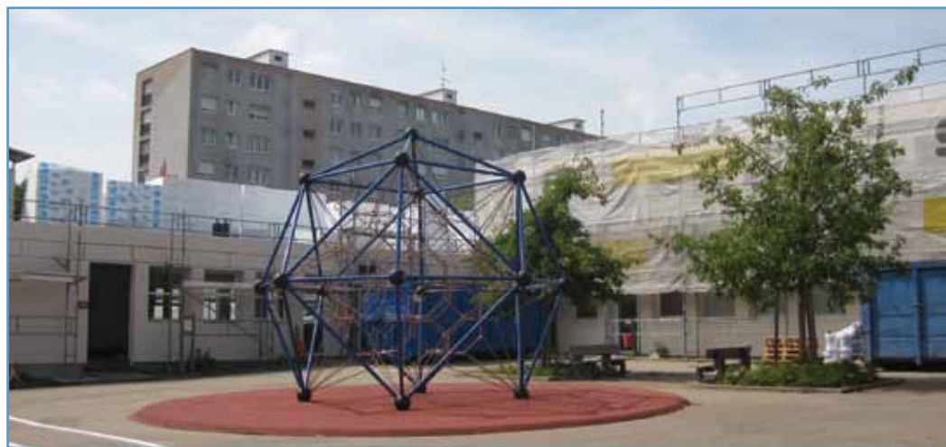
Le chantier de cet été