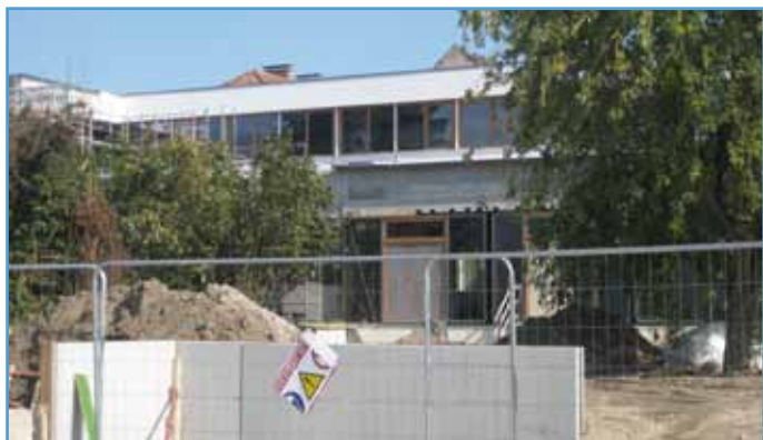
Le gros œuvre achevé de l'extension, c'est la cour qui est aménagée

Les enseignants ne souhaitant pas déménager au courant de l'année, leur installation se fera à la rentrée prochaine.