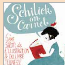
Illustration © Charlotte Gastaut

livres. Egalement projection de cinéma, spectacle et expositions. Dans le cadre de cette manifestation, deux illustrateurs Agathe Demois et Vincent Godeau rencontreront des écoliers de Hoenheim pour leur expliquer leur profession.