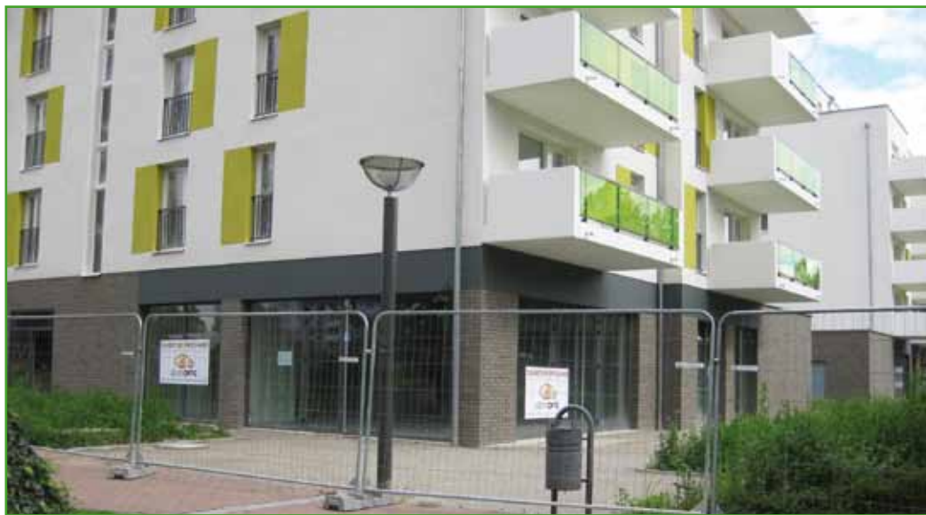
Côté tram, les rez-de-chaussée seront bientôt occupés par des commerces.

tière avec la construction des deux derniers bâtiments est prévue pour début janvier.