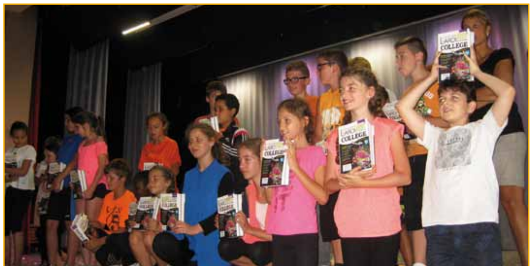
Après le spectacle, les futurs collégiens ont reçu un dictionnaire de la Ville de Hoenheim

les dictionnaires (1 750 €) aux jeunes avant de les convier à un goûter.