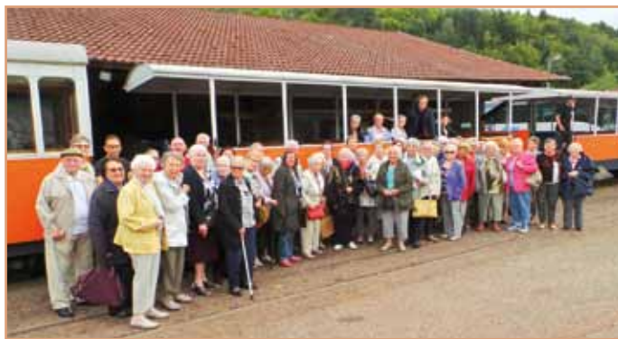
Photo souvenir au petit train forestier d'Abreschviller

• Les prochains Kaffeekränzel à l'attention des personnes isolées, pour passer un moment de détente autour d'un café-gâteau, auront lieu : le mardi 5 décembre au centre socioculturel , le mercredi 8 novembre à la salle des fêtes . Pour les inscriptions, merci de vous annoncer la veille du rendez-vous, avant midi, auprès du CCAS au 03 88 19 23 63.