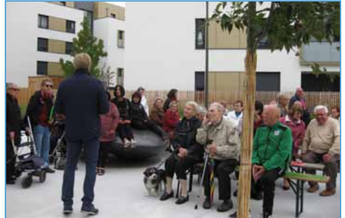
C'était la première réunion publique à l'écoquartier, après son inauguration en juin

quartier du Centre sera équipé au premier trimestre 2018. Des habitants ont demandé davantage de signalétique pour mieux identifier les bâtiments. Installation d'une boîte aux lettres, demande d'une aire de jeux, la circulation, autant d'autres points abordés.