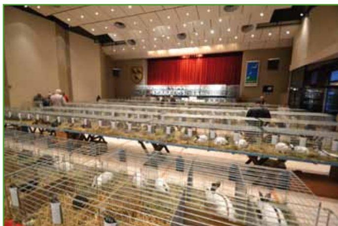
La salle des fêtes accueillera des lapins, pigeons et volailles