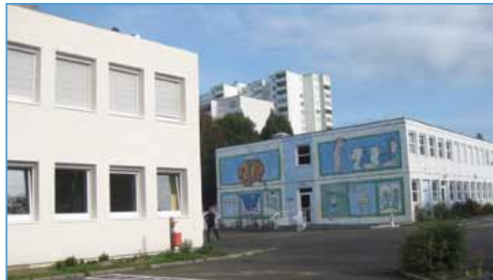
A gauche le bâtiment rénové

dans la rue du Waldeck pour assurer plus de luminosité aux salles.