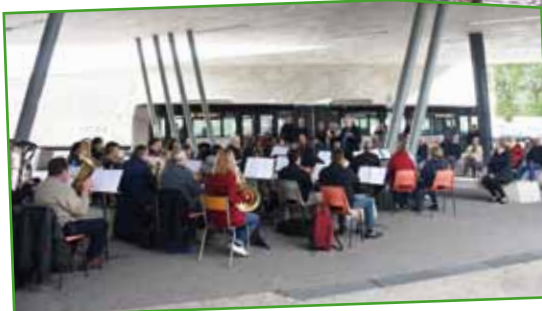
De la musique pour les usagers de la station construite par Zaha Hadid