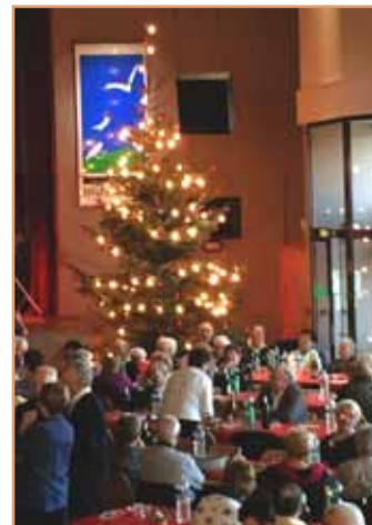
Ambiance de Noël et repas raffiné : les 424 seniors ont passé une bonne journée

• Dates des prochains Kaf-feekränzel : 4 janvier et 1er mars à la salle des fêtes, 7 février et 4 avril au centre socioculturel, de 14 h à 17 h. Une après-midi récréative est prévue le 26 mars à la salle des fêtes (voir p.13). Le véhicule social poura emmener les personnes isolées. S'inscrire une semaine avant au CCAS au 03 88 19 23 63.