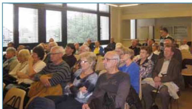
Du public et des questions

Autre problème évoqué : le stationnement de nombreux habitants dans la rue alors qu'ils ont des garages. « Il faut être le moins égoïste possible. Si le garage est utilisé à d'autres usages, il faut prévoir un nouvel espace de stationnement. Le bien vivre ensemble, c'est respecter son voisin », a commenté le maire. Il a mentionné les contrôles quant à certains trafics dans les parcs et