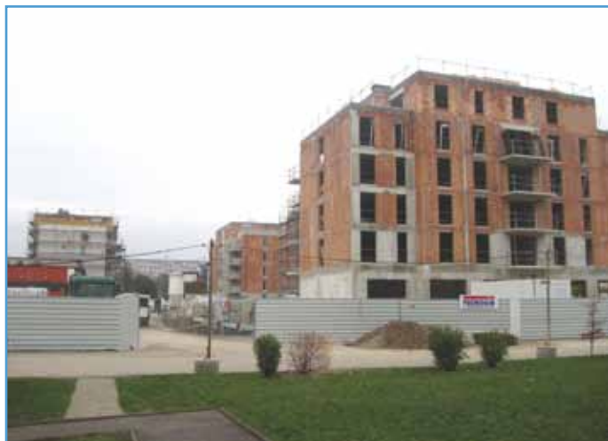
Le Carré Jardin compte déjà quatre bâtiments

Autres atouts : un stationnement en sous-sol à raison d'une place par appartement et le maintien de places en surface, dont celles actuellement devant la partie restante du centre commercial. Démarrée en décembre 2015, cette opération se poursuivra avec la démolition du reste du centre commercial et la construction des deux derniers bâtiments qui abriteront des commerces en rez-de-chaussée.