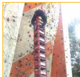
Parmi les épreuves : arriver à empiler le plus de cageots (Document remis)

A noter : la prochaine opération « Tickets Sports » aura lieu du 13 au 24 février.