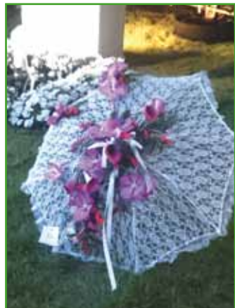
Estelle Girolt a été 2ème au concours Interflora