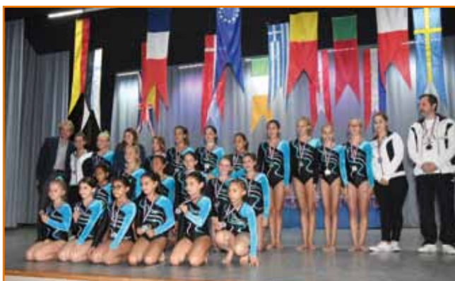
Société de gymnastique St-Joseph