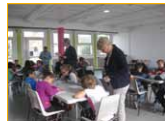
Deux classes ont participé à la dictée d'ELA faite par le maire

détruit la myéline des nerfs. Cette campagne est l'occasion de discussion sur la maladie, le handicap et la solidarité. Cette dictée était l'amorce de la semaine de sensibilisation de l'opération « Mets tes baskets et bats la maladie », avec un cross, et, fin juin, une journée de jeux.