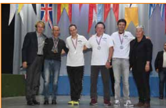
Le Tennis Club