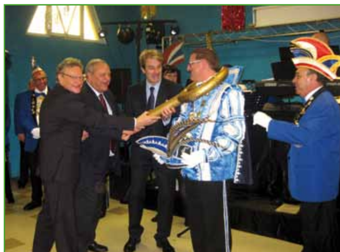
La clef a servi comme un lasso

Le défilé partira le 5 mars à 14h45 de Hoenheim.