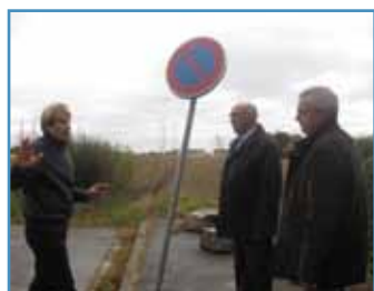
Au bout de la rue Anatole-France

Régulièrement, aux lendemains des réunions publiques qui per-