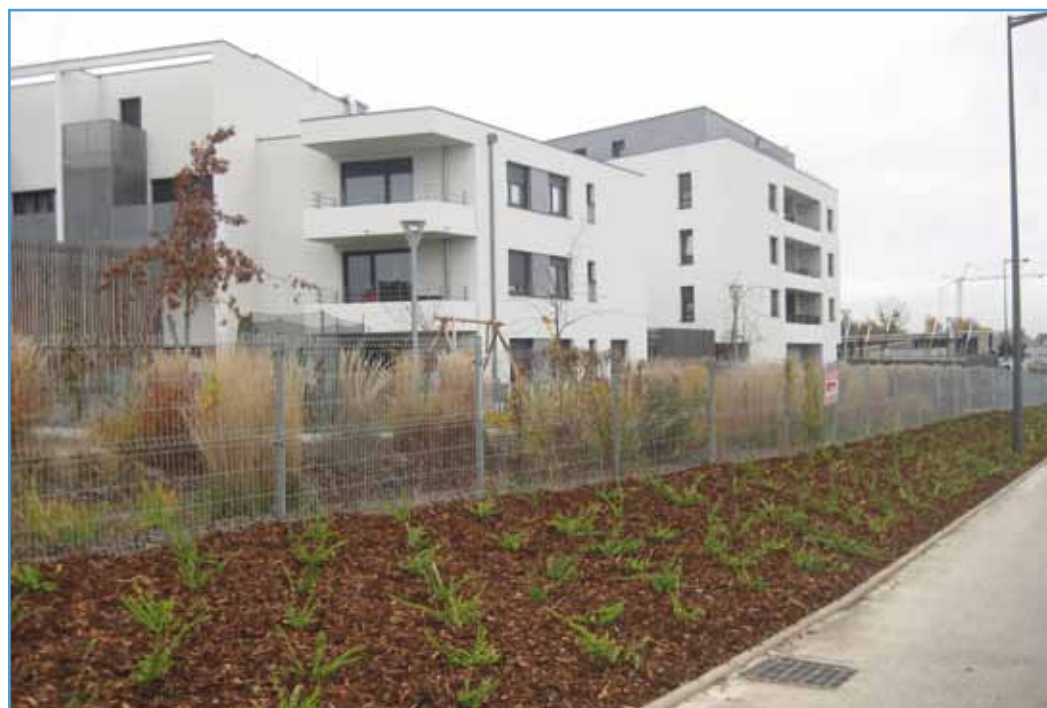
Plantations et surfaces stabilisées pour la bordure du quartier

zenau, soit quelque 900 m 2 . L'aménagement de cette surface avec des espaces verts et des plantations de haies a coûté 34 320 €.