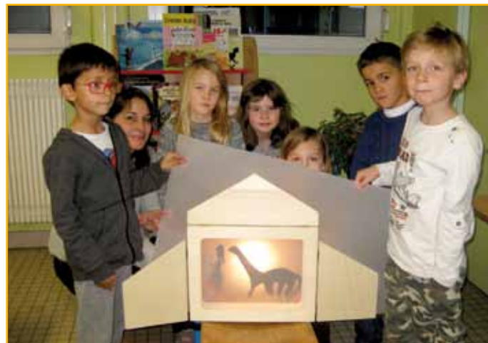
Le kamishibai a permis de concilier imagination et technicité