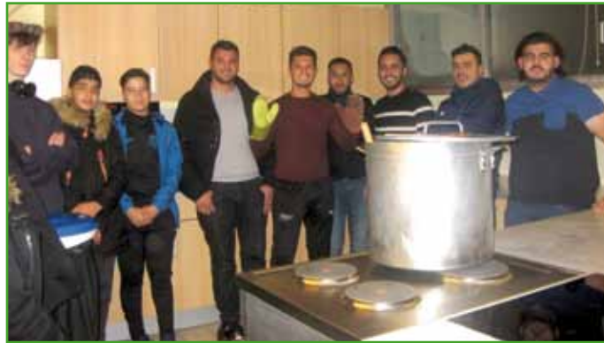
Quelques jeunes dans la cuisine du centre socioculturel pour préparer les plats à distribuer (Photo DEWH).

couscous, spécialités mauriciennes, les plats changent en fonction des nationalités : « Un vrai tour du monde grâce à cette collaboration ». Un supermarché de Brumath et un commerçant d'Ernolsheim offrent les ingrédients nécessaires. La page Facebook du collectif a joué son rôle,