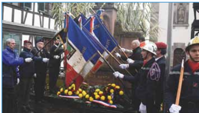
Se souvenir et agir

Lors de la commémoration de l'Armistice de 14-18 devant le monument aux Morts, le maire a appelé son auditoire à se souvenir des soldats et civils morts lors de la Première guerre mondiale : « Nous nous souvenons et nous constatons ». Le constat, ce sont les menaces sur la paix et la liberté : « La guerre n'est plus dans les tranchées. Elle est arrivée à la rédaction de Charlie Hebdo et au Bataclan ». Face à la stratégie terroriste de faire grandir la