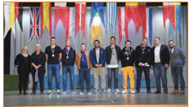
Le club de Basket