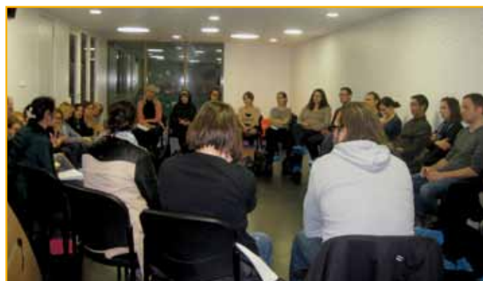
Une vingtaine de parents sont venus à cette réunion d'informations au multi-accueil « Les Champs fleuris »

• Fête de Noël : 16 décembre à 14 h à la salle des fêtes.