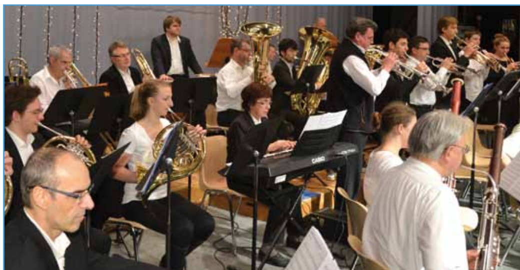
Rendez-vous avec les musiciens de la société municipale

Au programme également le 2 e mouvement du concerto en Sol pour piano et orchestre du même compositeur, ainsi