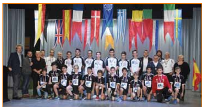
Le club de Handball