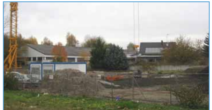
Les fondations et le terrassement sont en cours, à côté du terminal du tram

D'une surface totale de 622 m 2 , l'édifice comportera un rez-de-chaussée et un étage. Au rez-de-chaussée : cinq travées pour les véhicules, le bureau d'alerte et les vestiaires, à l'étage les bureaux et la salle de réunion. La fin du chantier est programmée pour juin prochain.