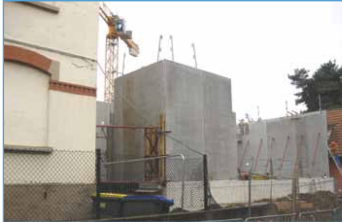
L'aile qui réunira les deux anciens bâtiments commence à s'élever

La fin de tous les travaux de l'école maternelle est fixée à juin 2018. Les travaux de l'Ecole de musique devraient s'achever pour décembre 2018.