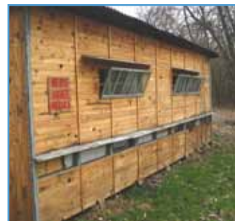
Des ruches ont été accueillies en 2012 à la Vogelau pour favoriser la pollinisation

La végétation spontanée, les supports de sensibilisation, les démarches pour impliquer les citoyens, autant de thèmes sur lesquels nous reviendrons dans le prochain journal.