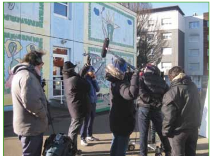
Tournage dans la cour de l'école élémentaire Bouchesèche (Photo DEWH).

• La production « Les films du Tonnerre » recherche une maison pour le décor de son film « La cuillère en argent » pour dix jours, fin 2016-début 2017. Une rémunération est prévue. Renseignements : contact@lesfilmsdutonnerre.com . Aussi des séries télé pour ARTE (apparetements anciens, grand moderne, maison de campagne) : gontran.froehly@gmail.com .