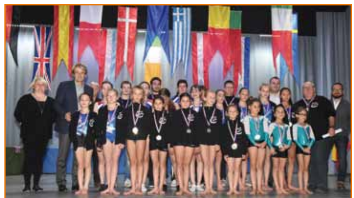
Société de gymnastique Liberté