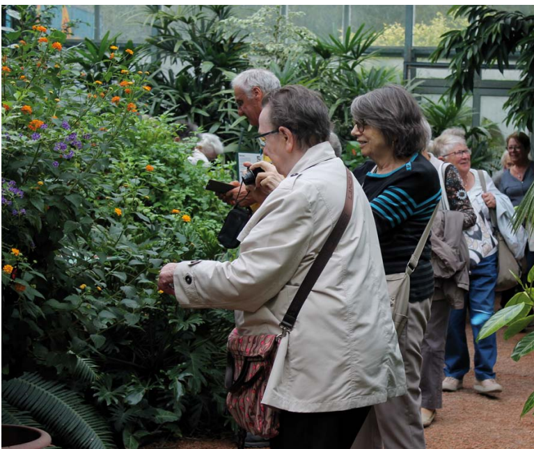
Une partie du groupe dans la serre du Jardin des papillons à Hunawehr.

Pour ces rendez-vous, la ville met à disposition un service de transport via les véhicules sociaux. Contactez le CCAS au 03 88 19 23 63.