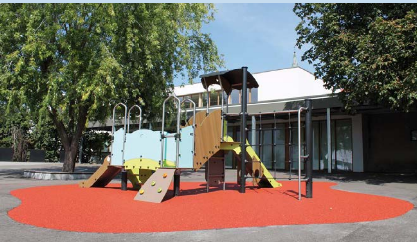
Une nouvelle structure de jeux extérieure a été installée dans la cour de l'école maternelle du Centre pour un montant de 24 660 €

Une enveloppe de plus de 65 000 € a été consacrée à ces travaux d'entretien et d'amélioration, sans compter les nombreuses réparations réalisées en interne, par les agents communaux.