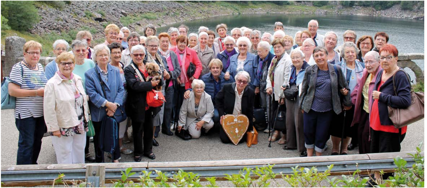
Le groupe de participants pose devant le Lac noir, sur les hauteurs d'Orbey.