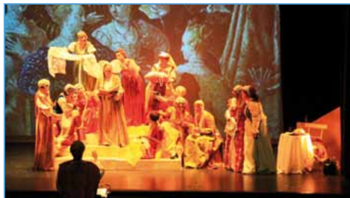
Des chants et de l'histoire (Document remis)

• dimanche 24 septembre à 17 h à la salle des fêtes. Entrée 10 € (5 € pour les - de 16 ans).