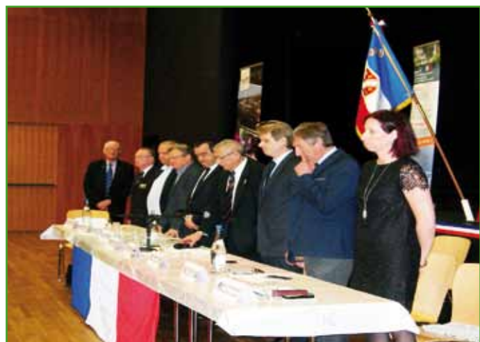
L'assemblée générale de l'UNC CUS Nord a eu lieu cette année à Souffelweyersheim (Document remis)

• Permanences les 3ème mardi de 18 h à 19 h et samedi de 14 h à 16 h à la Maison des associations, 67 avenue de Péri-gueux à Bischheim.