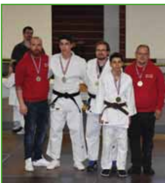
Le Judo Club