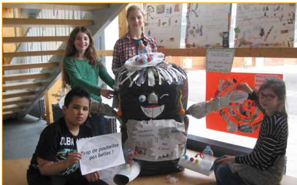
Madame Poubelle, fabriquée avec les déchets de cinq jours, était bien ronde

Les enfants ont été invités à réfléchir comment améliorer la situation. Réduire en amont les déchets, mieux les trier, réaliser du compost, les écoliers ont conçu des affiches avec ces notions. Ce qui a permis un travail d'écriture concret avec la création de slogans. Quelques titres : « Moins de poubelles, la vie est belle », « Zéro déchet par terre, c'est un grand geste pour la terre », « Réduire les déchets, c'est du respect », « Plus on trie, plus