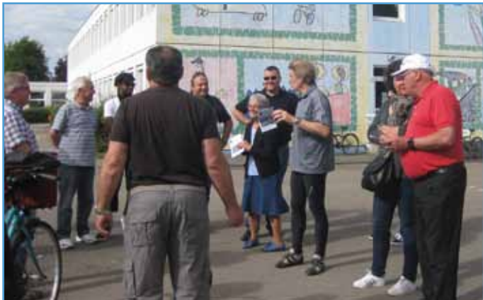
Parmi les arrêts : l'école élémentaire Bouchesèche et le chantier programmé sur deux étés

Rue du Stade, le maire a détaillé le projet des club-house, vestiaires et gradins pour le football avant d'emmener son peloton à l'écoquartier « L'île aux Jardins » qui est achevé. Les élus ont vu l'avancement du futur centre d'incendie et de secours Hoenheim-Souffelweyersheim, puis rallié l'école maternelle du Centre où le gros œuvre de l'extension est achevé. Ils ont découvert les nouveaux motifs réalisés sur le mur des Vosges, dans l'attente de sa finition durant l'été. Dernier arrêt : le quartier Ouest avec le bout de la rue Anatole-France et les différentes options d'aménagement.