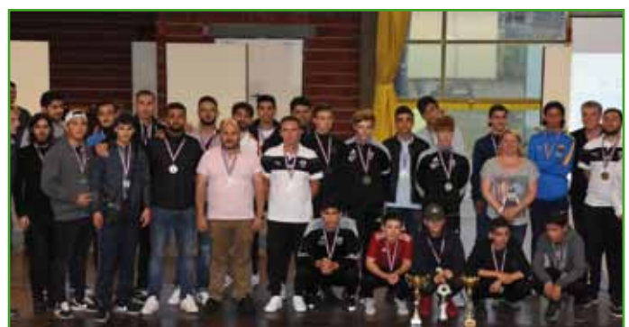
Le SRH Football