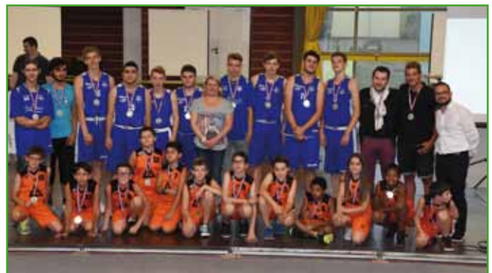
Le Basket Club