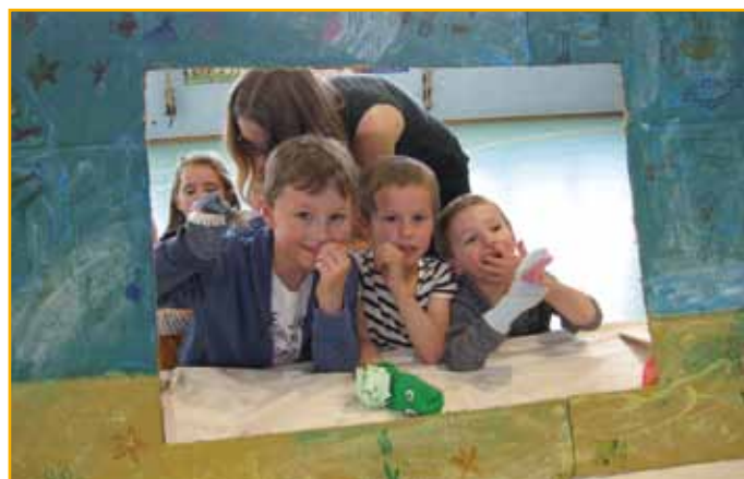
Un castelet, des gants, des marionnettistes et le plaisir de jouer.

nettes en forme de gants, incarnant les différents personnages de l'aventure. D'autres écoliers, venus en spectateurs, ont applaudi leurs copains, au terme de la représentation.