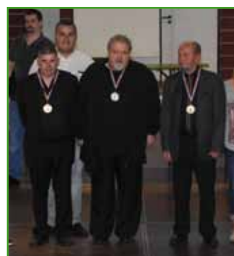
Les Amis du Billard, en deuil de leur président