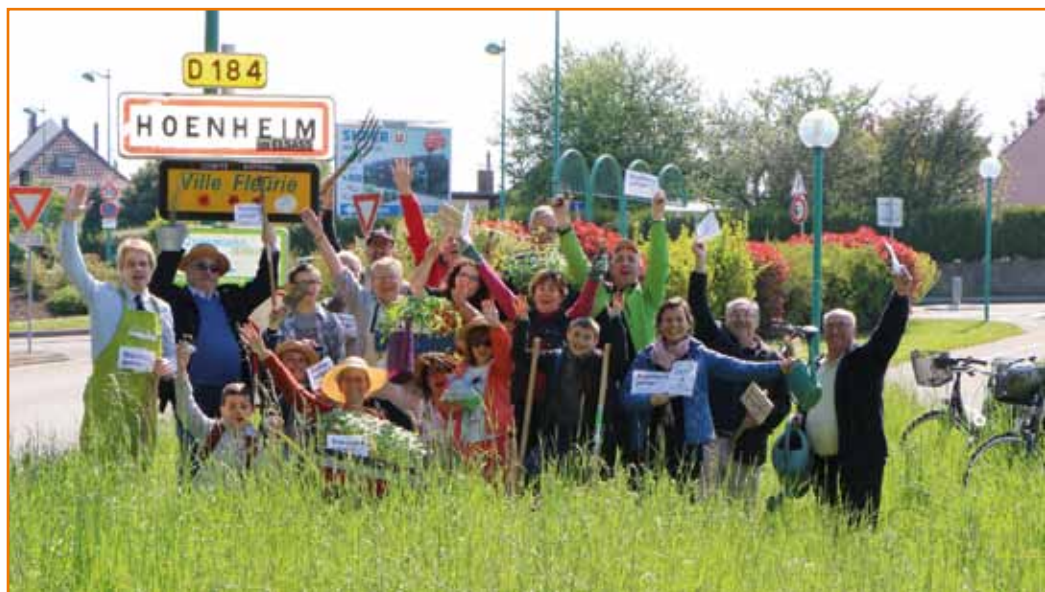
Une équipe pour adhérer à l'opération « Incroyables comestibles »

• Pour tout contact et renseignement : henecomestibles@gmail.com