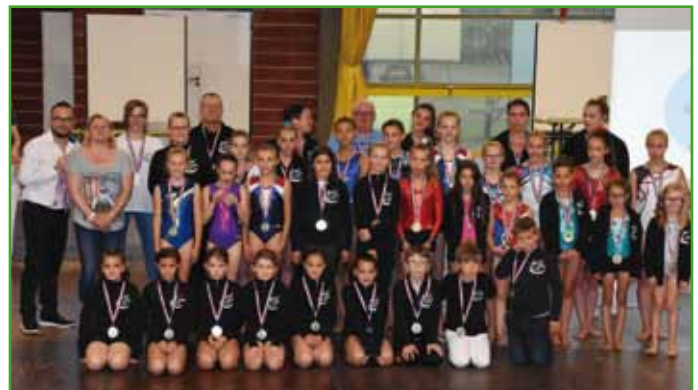
Gymnastique Liberté Bischheim-Hoenheim