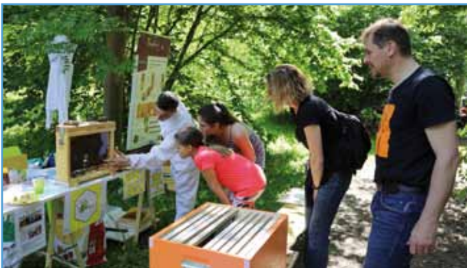
Un apiculteur a bien expliqué le monde des abeilles et de la ruche

La première Fête de la Nature, en lien avec la manifestation lancée au niveau national, a connu un beau succès, avec la participation de quelque 300 personnes, tout au long de la journée. Organisée à la Vogelau, elle a permis à beaucoup d'habitants de découvrir ce coin de verdure, à quelques encablures de la ville. Le fil conducteur était : « Observons, écoutons la nature en famille ».