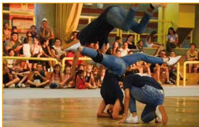
La troupe Mistral-Est a présenté son spectacle de hip-hop

tacle de hip-hop. Les figures acrobatiques, jouant sur les limites de l'équilibre et les rythmes, ont été très applaudies. Puis place aux musiques variées, mixées par le DJ Yoven pour se donner un avant-goût des vacances, avec beaucoup de transpiration !