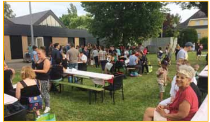
Des tables et des bancs pour un pique-nique convivial

les assistantes maternelles du RAM (Relais des assistantes maternelles), des jeux de ballons et de cerceaux, des déambulations avec des petits vélos. Dans cette ambiance détendue, avec la douceur de cette fin de journée ensoleillée, les parents ont pu discuter à loisirs et échanger sur les progrès de leur progéniture.