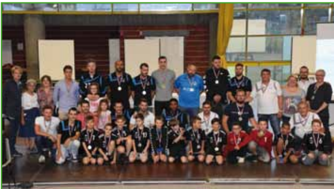
Le club de Handball