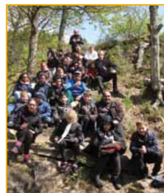
Pause près du rocher du Falkenstein (Document remis)

charge l'intendance entre ménage, préparation des repas et organisation des soirées. Durant ces vacances, d'autres jeunes ont participé à un atelier chorégraphique et théâtre, à la visite au zoo de Bâle, à une initiation au handball et hockey. Certains ont poursuivi la réalisation de la fresque, rue des Vosges.