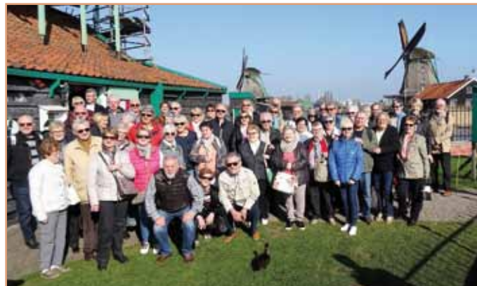
Entre deux visites : le groupe des touristes de Hoenheim (Document remis)

fleurs à bulbes. La dernière journée a été l'occasion de vi-