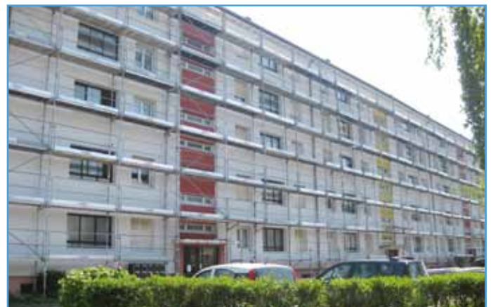
OPUS 67 a fait d'importants travaux sur l'immeuble rue de la Robertsau

Un chantier similaire devait démarrer sur l'immeuble 6-8 et 10 rue Alexandre-Fleming, avec trente appartements, mais les nombreux nids d'hirondelles ont obligé le bailleur social à décaler les travaux à fin septembre. Coût global : 335 000 € pour le ravalement des façades, 360 000 € pour la mise en sécurité électrique des logements et des communs, 100 000 € pour la VMC et 224 000 € pour le remplacement des menuiseries extérieures.