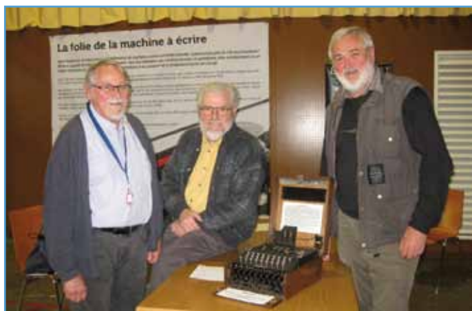
Trois passionnés pour une exposition exceptionnelle

• de 14 h à 18 h à la salle des fêtes, sauf les dimanches ouverte à partir de 10 h. Entrée libre.