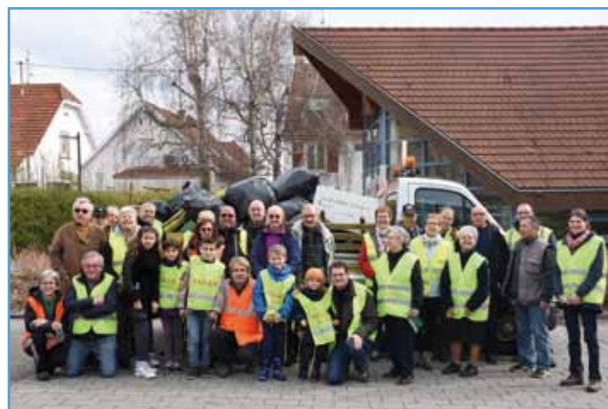
Un coup de propre, un camion plein