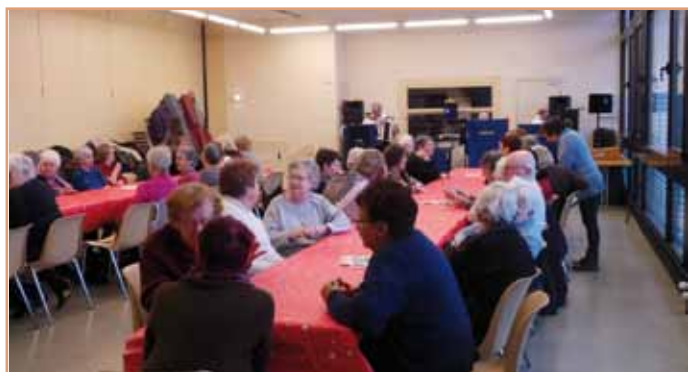
Musique et galettes pour le premier Kaffeekränzchen de l'année (Document remis)

• Les prochains rendez-vous : mercredi 3 mai à la salle des fêtes, mardi 6 juin au centre socioculturel, mercredi 5 juillet (lieu à définir selon le temps). Pour les inscriptions, s'adresser la veille, avant midi, au CCAS au 03 88 19 23 63.