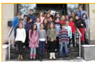
Découverte de la mairie, ses services et son rôle pour la classe de CM1/CM2

Dans le cadre de l'opération « Odyssée citoyenne », une classe de CM1/CM2 de l'école élémentaire Bouchesèche est venue découvrir la mairie en janvier. Cette opération, financée par l'Eurométropole et organisée par l'association Themis, a pour objectif d'aider les enfants à devenir des citoyens