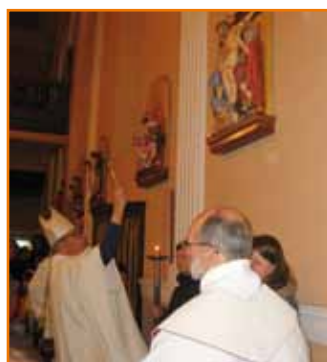
Des membres du Petit Clou ont été mis à l'honneur pour leur travail de restauration