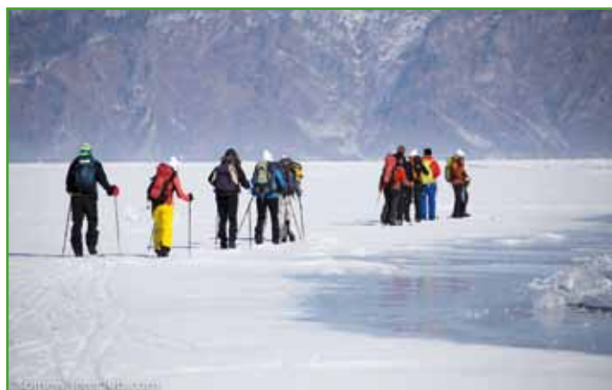
Du bleu, du blanc, des températures entre - 15 et - 20 °, le défi a été réussi

• Pour toute information : Vue (d') Ensemble, 7B rue des Emailleries, 67800 Hoenheim, vuedensemble.contact@gmail.com .