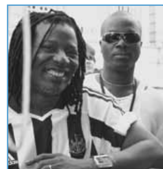
Manouté Seri avec Alpha Blondy (à gauche) (Document remis)

• Pour tout contact : info@lafriquefestival.com .