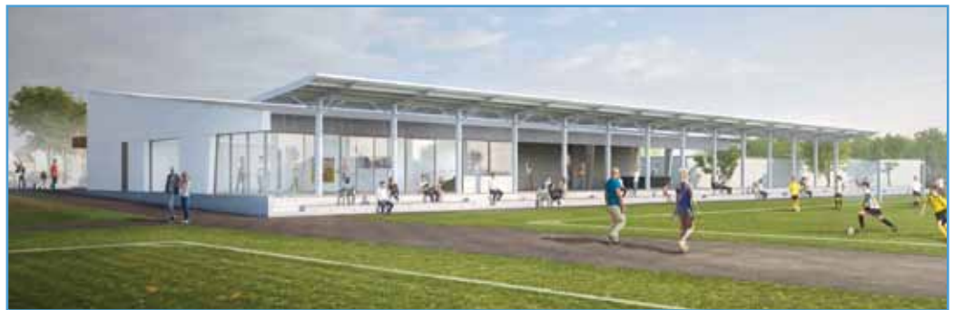
Le nouveau bâtiment regroupera un club-house, des vestiaires et des gradins (Document cabinet Bergmann et associés)

Le volume extérieur sera en béton, avec une charpente métallique, poteaux, poutres et une couverture en zinc. Les gradins en béton, sur deux niveaux, et d'une capacité de 280 spectateurs, seront surmontés d'un platelage bois. Le tout donnera diverses nuances de gris, en accord avec les couleurs du club du S.R. Hoenheim.