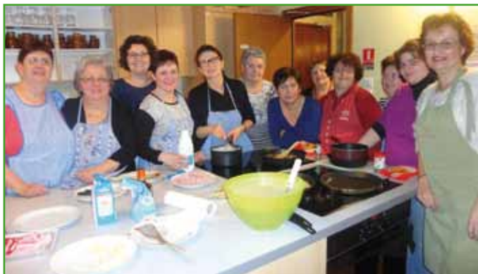
L'équipe des cuistots du mardi (Document remis)

amandes, le livre a été réalisé en secret et offert le soir du Repas du monde, 10ème anniversaire, aux cuisinières. Du bonheur qui n'était pas seulement dans l'assiette !