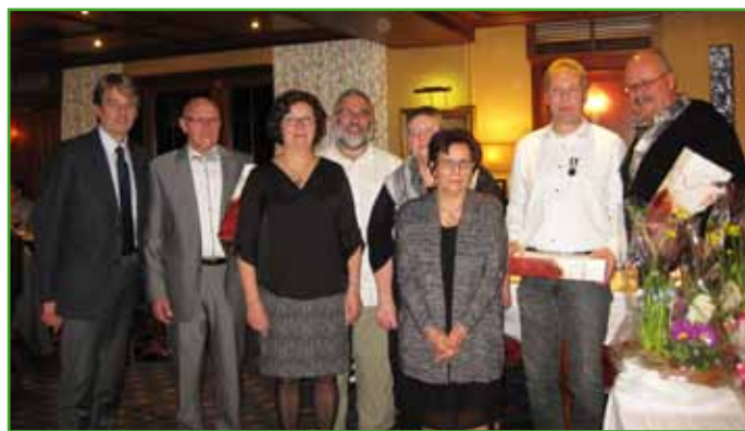
A l'honneur pour une médaille du travail et des départs à la retraite

Vincent Debes a remercié toutes les personnes à l'honneur pour les années passées à travailler pour la collectivité. Il a remis médaille, arrangements floraux et cartons de vin.