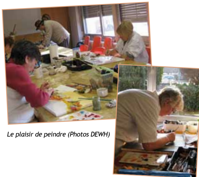
Le plaisir de peindre

L'AJRAH fête cette année son 20 ème anniversaire. Elle compte 280 membres. La soirée anniversaire à Kirrwiller a fait le plein. Au programme aussi : gymnastique, danse de salon, danse country, cartes, scrabble, informatique ... Pour tout renseignement : ajrah.hoenheim@free.fr