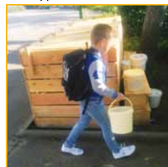
Un seau, des déchets à ramener et du compost pour les jardins (Document remis)

« Je suis contente que l'école soit un relais pour inviter à des comportements en faveur du développement durable ».