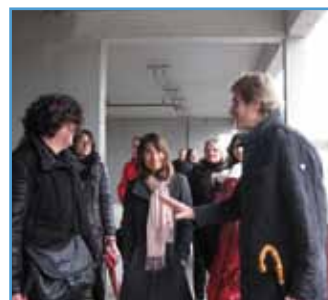
Visite de la nouvelle extension