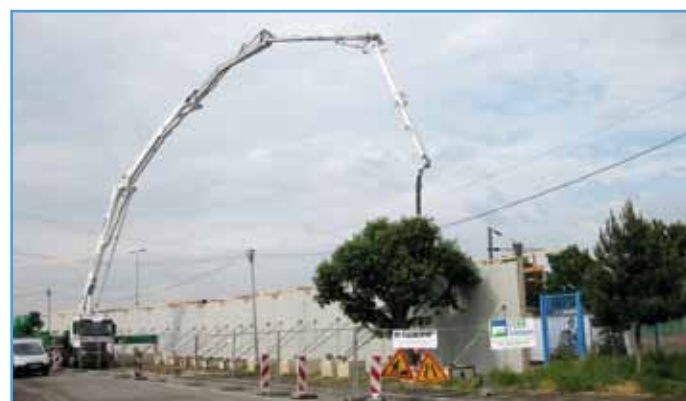
Moments spectaculaires : la démolition, puis la pose de nouveaux murs Les travaux auront lieu en juillet et août.