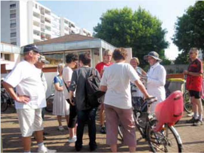
Arrêt devant la halte-garderie qui a fait l'objet de travaux d'isolation de la toiture et des murs

La vingtaine d'élus de la majorité municipale a eu du mérite à pédaler sous le soleil brûlant pour faire le tour du ban communal afin de faire le point avec le maire sur les chantiers achevés ou à venir ! La visite a démarré par l'école