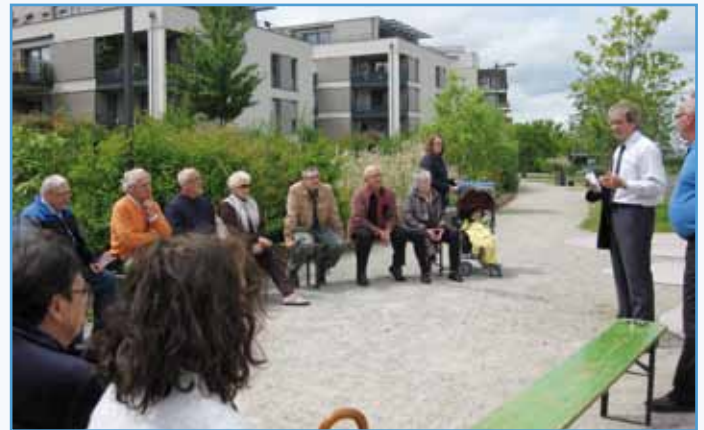
Au même endroit qu'à l'automne dernier pour faire le point sur des préoccupations des habitants des Emailleries

Ont été encore soulevés le problème de la sonnerie des cloches la nuit, le danger de certains chiens, la présence de personnes louches au square ... Le maire a lancé l'idée d'une chasse aux œufs au square, comme cela s'est fait à Pâques dernier dans le parc près du multi-accueil « les Champs Fleuris ».