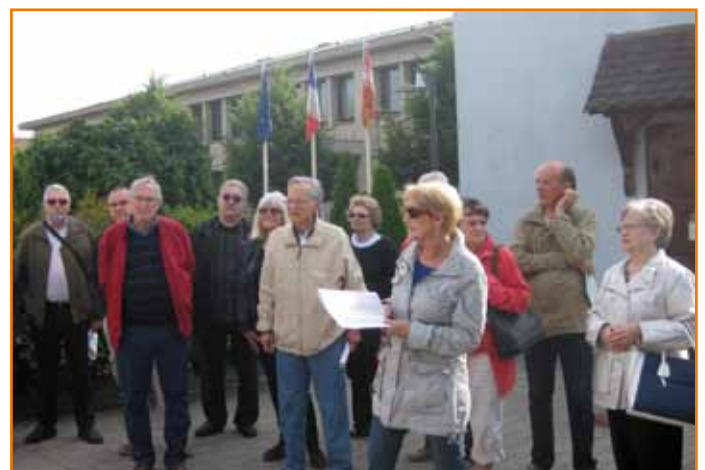
La tournée du ban a permis aux aînés de découvrir l'intérieur de la chapelle Saint-Jean

Les seniors seront aussi associés aux réflexions concernant le stationnement et la circulation. Ceux s'occupant de l'environnement participeront au jury lors des concours de fleurissement et de décorations de Noël. La commission avec le Centre communal d'action sociale proposera des visites de courtoisie à des personnes très âgées et des aides ponctuelles. Des contacts seront établis aussi avec le Conseil départemental. Des aînés pourront aussi donner leurs points de vue pour des choix de films à projeter et donner leurs avis pour des projets