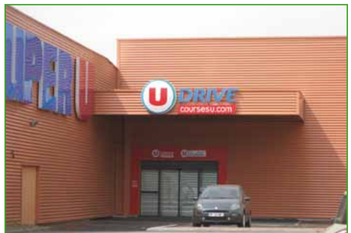
La formule Drive a son site sécurisé