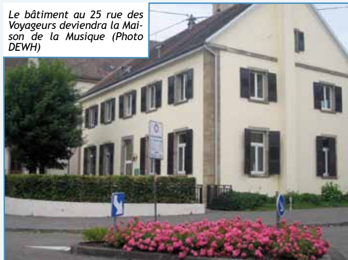
Le bâtiment au 25 rue des Voyageurs deviendra la Maison de la Musique

Un avenant en plus-value de 13 133 € a été accepté dans l'opération d'aménagement des ateliers municipaux. Après l'approbation de la convention-cadre du Contrat de Ville de l'Eurométropole, les élus ont pris acte du rapport d'activités du syndicat intercommunal pour la maison de retraite « Les Colombes ». Ils ont été informés sur le Plan de gestion des risques d'inondation, l'objectif étant d'interdire les constructions, remblaiements et endiguements nouveaux dans les secteurs inondables non urbanisés.