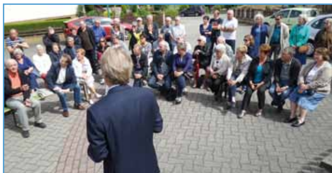
Plus de 70 habitants sont venus rencontrer le maire