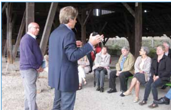
La réunion s'est tenue lors de la bourse aux plantes

Une vingtaine d'habitants sont venus discuter de la vie de leur quartier, à quelques mètres de la bourse aux