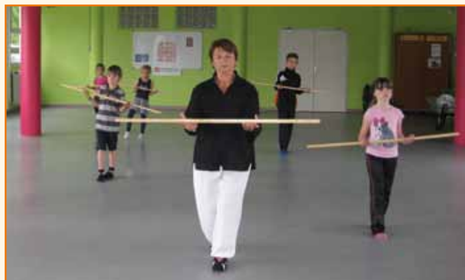
Parmi les activités proposées : le Qi Gong

Au terme de cette première année de fonctionnement, certaines activités seront reconduites en 2015/2016 comme la chorale, la danse en ligne, les bricolages, les travaux d'aiguilles. D'autres rendez-vous, mis en place après les vacances de printemps, seront maintenus : Qi Gong, danse folklorique et acrogym. A cette palette s'ajouteront des nouveautés à la prochaine rentrée comme un atelier bandes dessinées, du handball ou de l'aïkido. Dans le cadre du travail sur la citoyenneté sont prévus des projets pour faire réfléchir les jeunes sur leur environnement, avec notamment « Le petit quotidien » et des débats divers.