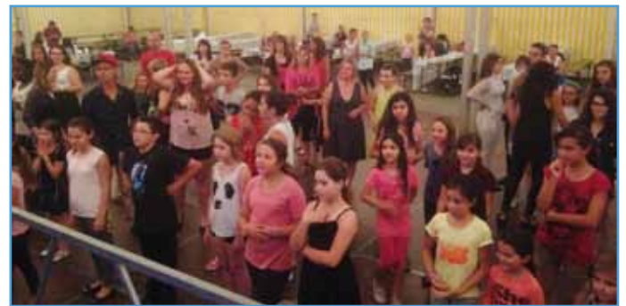
Rendez-vous sous le chapiteau le 4 juillet, comme l'an dernier

Après ces échanges, place à la fête avec la seconde édition de la soirée des jeunes , de 7 à 17 ans, avec le DJ Sébastien Obringer. Cette soirée (sans al-