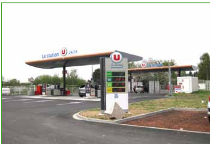
La station essence et l'aire de lavage ont été déplacées à l'arrière

l'Est à être ainsi équipées ». Le magasin est en wi-fi. Cette montée en puissance en matière de produits et d'agencement est complétée par une ouverture plus longue. Ce Super U est à présent ouvert toute la semaine de 8 h à 20 h, la boulangerie l'étant dès 6h30. Et petit détail qui fait la qualité : les portes de secours ont été peintes par un artiste qui a fait revivre l'ambiance d'une cave ancienne, avec ses tonneaux et ... créé le Château Hoenheim !