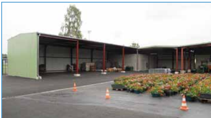
Un nouveau hall de stockage a été aménagé aux ateliers municipaux

Les ateliers municipaux ont fait l'objet de travaux démarrés à la mi-octobre et terminés en