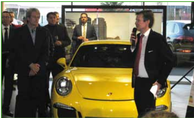
Inauguration du bâtiment rénové de Porsche

La prochaine Fête de l'Automobile (vente de véhicules d'occasion, animations) aura lieu les 10 et 11 octobre.