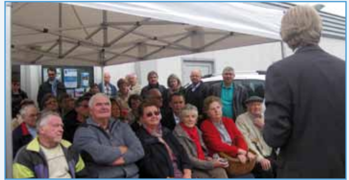
Les habitants du quartier Ouest sont venus nombreux à cette réunion pour faire le point avec le maire