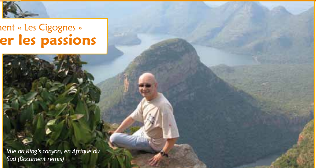
Vue du King's canyon, en Afrique du Sud

Une association qui date de fin des années 1970 et regroupe 75 familles, soit environ 350 personnes. A côté de la fête de quartier, cet ancien biologiste voudrait mettre sur pied une journée de promenade avec un déjeuner. Il songe à la création d'un site pour faire état des outils de bricolage et de jardinage, ainsi que des disponibilités et conseils des uns et des autres. Besoin d'une remorque, d'un coup de main pour une réparation, les occasions et les talents existent : « Ce serait pour augmenter la symbiose du lotissement et rendre des services à